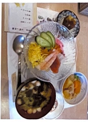
【土曜日×メニュー】 ちらし寿司・じゃがいもの煮物・味噌汁 栗ようかん