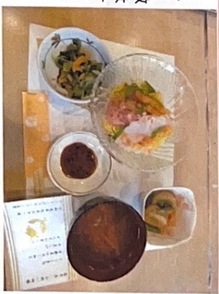
【木曜日×メニュー】 ちらし寿司・がんもの煮物 おひたし すまし汁