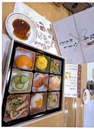
【金曜日×メニュー】 てまり寿司(マゲロ、サーモン、錦糸卵、エビ) 和え物・すまし汁・栗ようかん