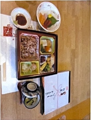
【火曜日×メニュー】 敬老会御膳(赤飯、煮物、なます、コラーゲン) 茶碗蒸し