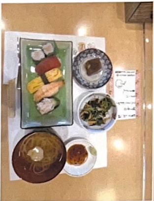
【月曜日×メニュー】 握りずし・おひたし・すまし汁 栗ようかん