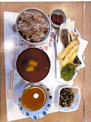
【水曜日×メニュー】 赤飯・天ぷら・おひたし・すまし汁 厨房の方が目の前で天ぷらを揚げて下さいました!

まだ暑さが残る 9月中旬、嘉響では長年にわたり社会に尽くしてきた利用者様に感謝の気持ちを伝えるべく、敬老会を開催しました。 今年はずく自粛していた長寿の表彰を再開、昼食にはささやかなごちそうをご用意し、利用者様の中には「敬老のお祝いをされるといいことは自分も年を取ったんだなと感じる。けれどやっぱりお祝いされるという事はいくつになっても嬉しいことだね!」敬老会で表彰してくれて、ごちそうまでもらってありがたいと言ってくさり、喜んでいただけました。